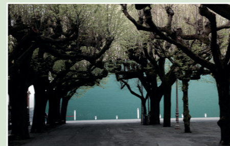
• PASEO DE LOS TILOS

Hernani debe volver a ser el pueblo amable, que invite a visitarnos y que facilite el consumo en nuestro municipio. También buscaremos la ubicación más adecuada para un aparcamiento en superficie.