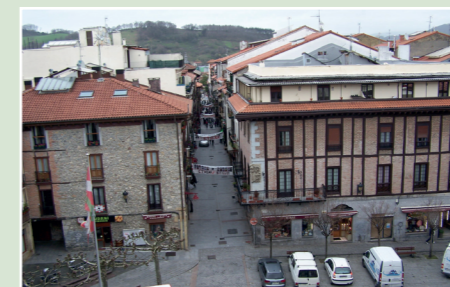
• VISTA DEL CASCO HISTÓRICO

Apostamos por un paso elevado que permita a los residentes en La Florida, Antziola y Etxeberri salir y entrar de forma rápida y ágil.