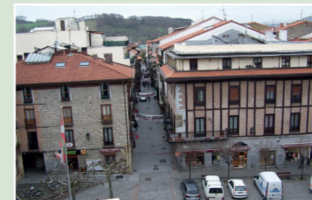
• ALDE ZAHARRA

Gaineko pasabidea egingo dugu Florida, Antziola eta Etxebarriko bizilagunen jaan-etorriak errazteko.