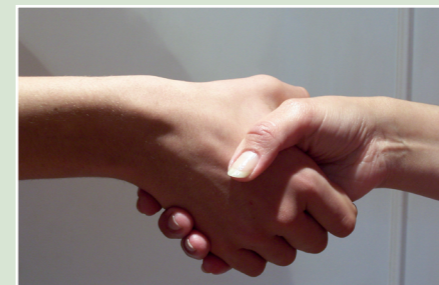
• MEJORAR LA CALIDAD DE VIDA DE LOS HERNANIARRAS

Todos tenemos derecho a una vida digna y desde EAJ-PNV no vamos a dejar de lado a ningún hernaniarra que necesite nuestra ayuda.